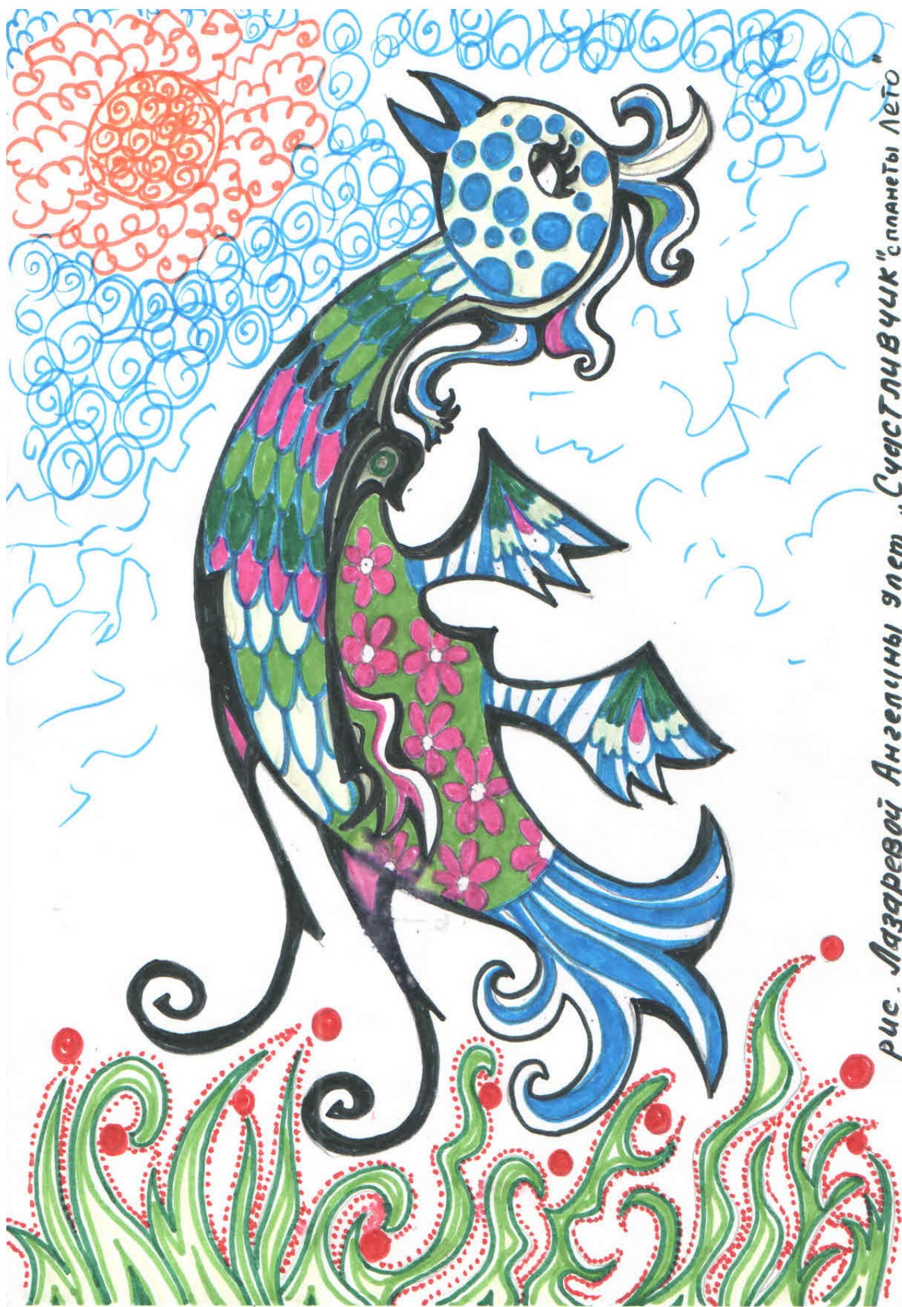
рис. Лазаревой Ангелины злет „Счастьлчвччк“спланеты Лето